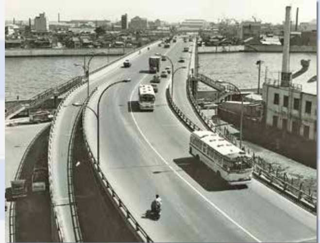
『美しい佃大橋』昭和39(1964)年

昭和39年(1964)8月27日には、佃大橋の開通式が盛大に行われました。住吉神社の神輿・獅子頭が写る開通式の写真や、西仲通り商店街で催された祝賀大売り出しのポスターが残っています。開通式の同日に佃の渡しの廃止式が行われ、佃の渡しは姿を消すこととなりました。