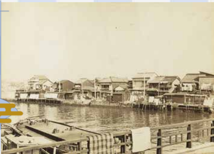
『佃橋から佃島9、10番地の河岸を見る』 昭和31(1956)年