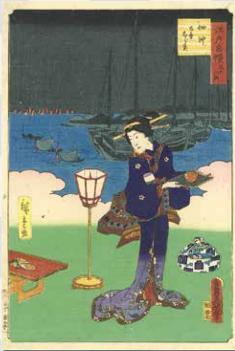
『江戸自慢三十六興 佃沖 名産 志ら魚』 歌川広重(2代目)画 歌川豊国(3代目)画 1864年